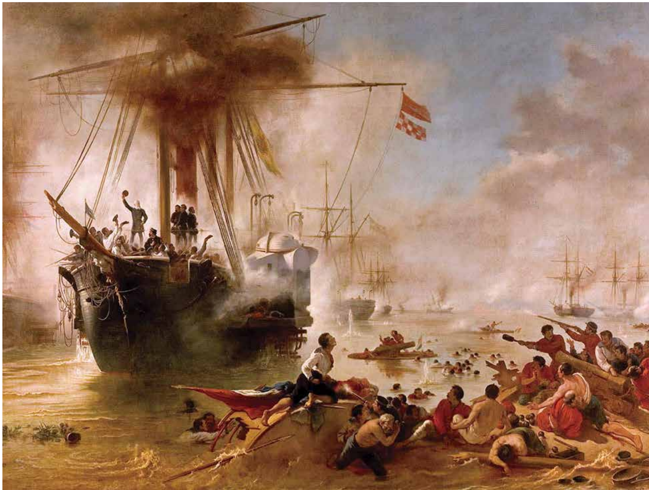
Batalha Naval do Riachuelo, 1882/83. óleo sobre tela, 4 x 8 m, Acervo Museu Histórico Nacional/IBRAM/MinC