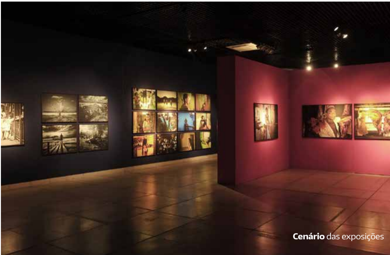
Cenário das exposições